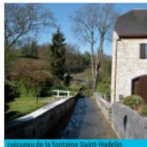
noiveau de la fontaine Saint-Hadelin

Celles, afgeleid van het Latijnse cella(-cel) heeft zijn naam te danken aan de Heilige Hadelinus (617-690), afkomstig van de Guyennestreek in Frankrijk. Na een lange zwerftocht trekt deze missionaris zich terug in een grot in de wouden rond de Lesse. Later voegen heel wat volgelingen zich bij hem. De cellen die zijn gezellen er bouwden hebben hun naam aan het dorp gegeven.