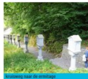
kruisweg naar de ermitage

typisch romaanse houten zoldering, een mooie doopvont uit de 13de eeuw, en een koorlessenaar uit natuursteen.