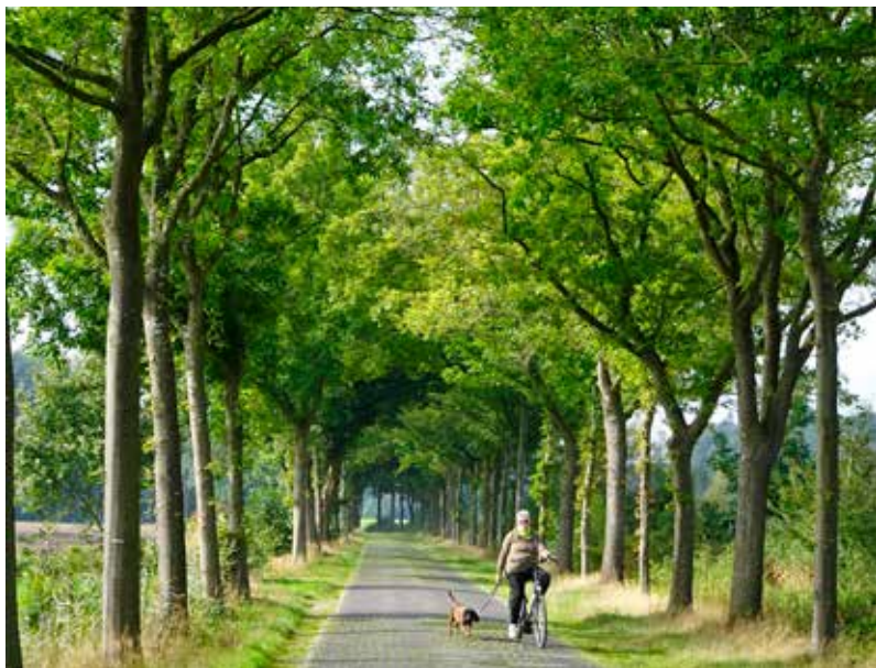
Dokkeren op een van de vele klinkerwegen.

de ondiepe Wattensee te turen en in de verte een sliert waddeneilanden uit de zee te zien opduiken. Voor de rest van de tijd fietsen we benedendijks naast de vruchtbare polders. Op den duur toch een weinig opbeurende belevenis, hoewel fietsen in de luwte van de dijk toch een comfortabele bezigheid is ... tenminste als de wind goed zit.