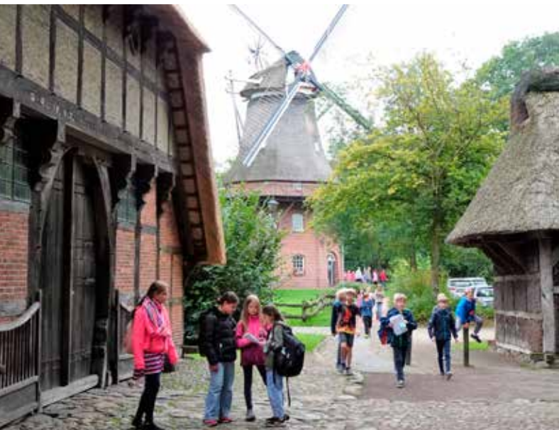
Het openluchtmuseum van Bad Zwischenahn.