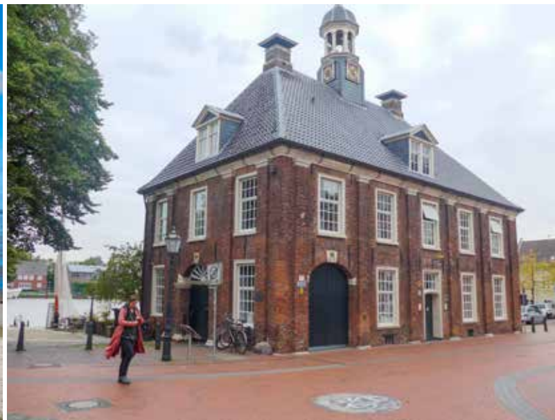
Oud havengebouw in Leer.

de goudgele zandstranden vol met de typische 'Strandkorben', grote uitgebouwde zetels waarin je verscholen in een zonbeschermd nest kan genieten van de aanklotsende Noordzeegolfjes.