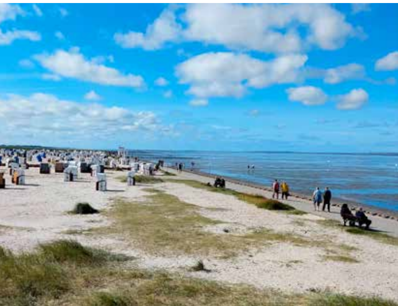
Op het strand van Harlesiel.