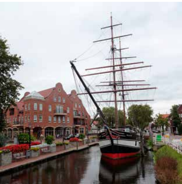
Opgeknapte zeilschepen in Papenburg.