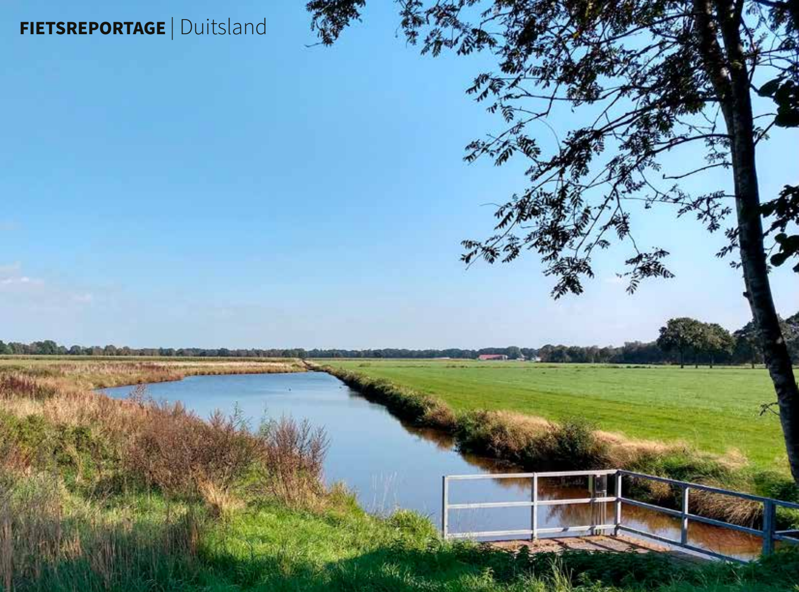
Een veenkanaal doorklieft het vlakke landschap.